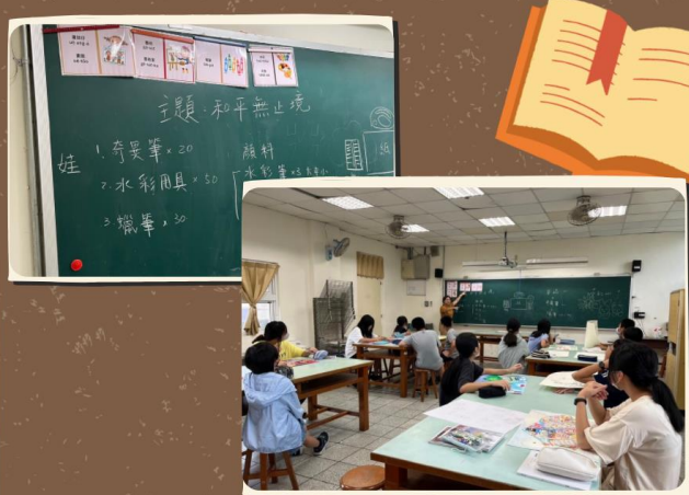
說明：母語日活動週鼓勵各領域教學融入課室台灣臺語。