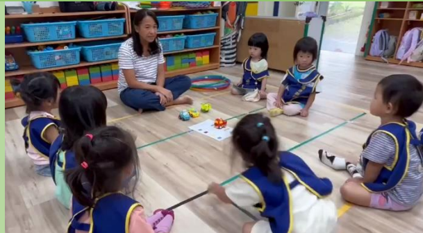
說明：向下紮根，幼兒園母語日教學。