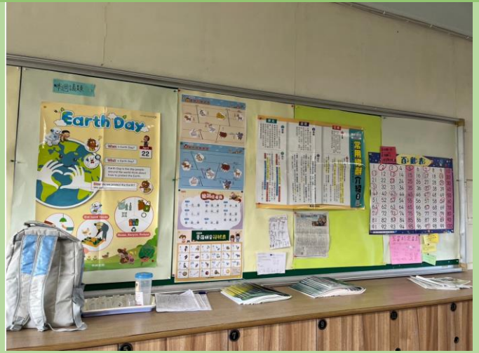
說明：教室佈置融入台語教學。