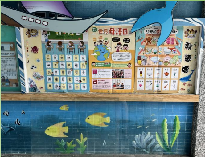
說明：川堂布置，靜態海報展示。