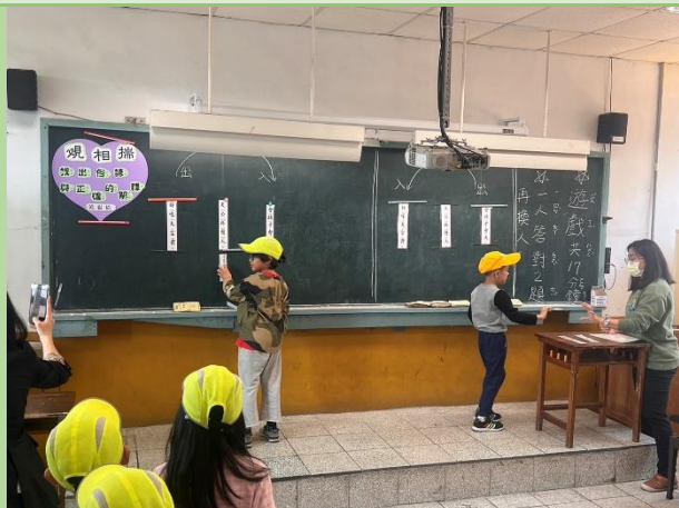
說明：國小部母語日活動—規相揣 bih-sio-tshuē，找出對應俚語及其解釋。年段對抗賽，戰況激烈。