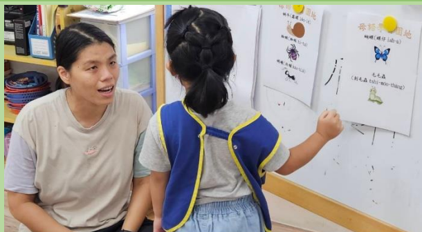
說明：向下紮根，幼兒園母語日教學。