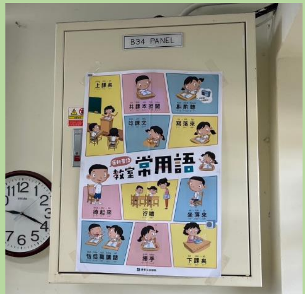
說明：靜態本土語情境不只融入在各班班級教室，更結合校園環境融入到校園各處角落，體驗沉靜式閩南語教學。