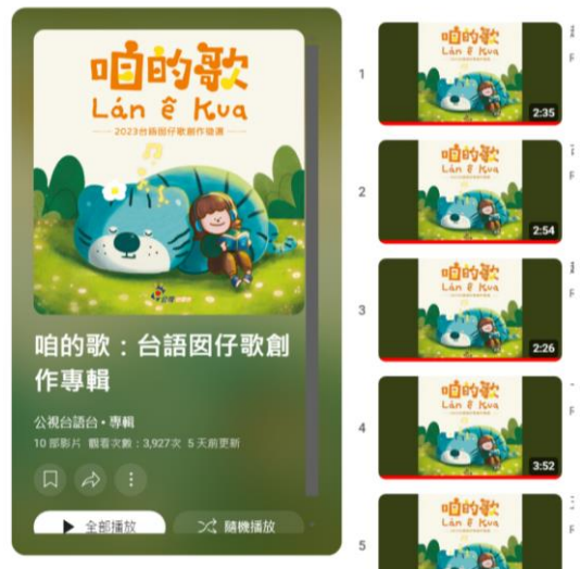
說明：學校網站建置本土與教材專區，遠距教學不受時間和距離阻礙！

網址： https://www.aodi.ntpc.edu.tw/p/403-1000-67.php